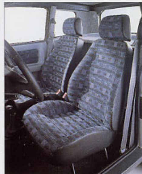
Sièges ergonomiques version standard.