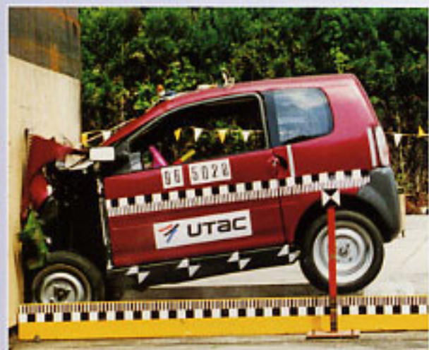
PV d'essai N° 96/05028

Les portières sont équipées de barres de protection contre les chocs latéraux.