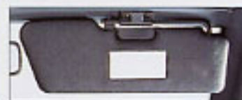
Pare-soleil orientable avec miroir de courtoisie côté passager, porte-carte côté conducteur.