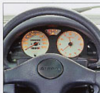
Modèles STANDARD, LUXE et SUPER LUXE.