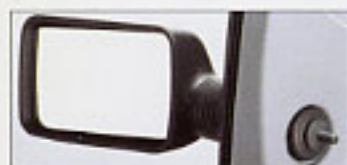
Rétroviseurs réglables de l'intérieur.