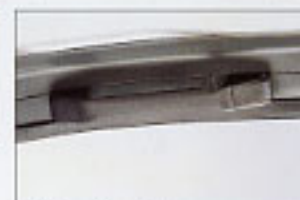
Poignée de maintien passager.