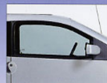
Rétroviseurs couleur carrosserie.