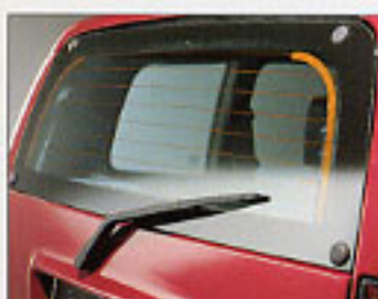
Lunette arrière dégivrante avec essuie-glace.