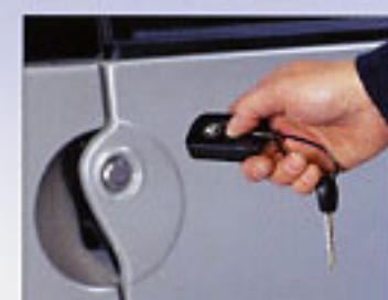
Fermeture centralisée avec télécommande.