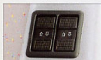
Commande de vitres électriques.