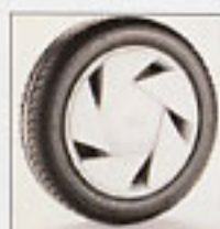
Enjoliveur de roue.