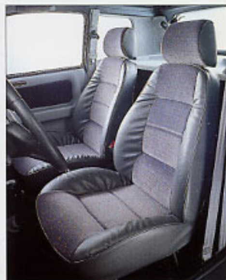
Sièges ergonomiques version luxe.