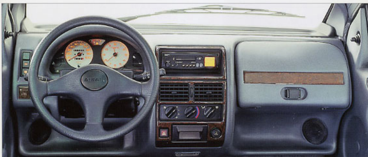
Tableau de bord : instrumentation très complète et sophistiquée, modèle SUPER LUXE.