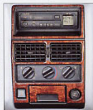
Autoradio cassette stéréo.