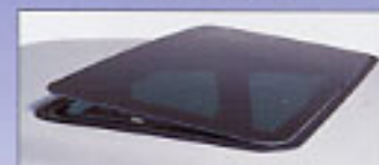
Toit ouvrant entrebâillé.