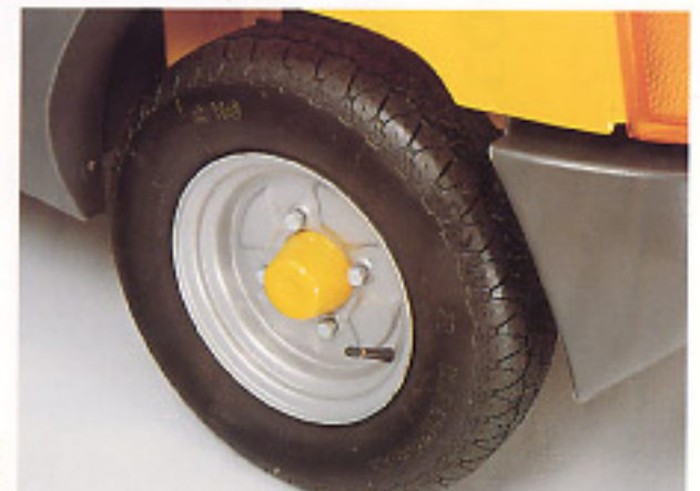
Un enjoliveur de roue personnalisé, un plus à la finition.