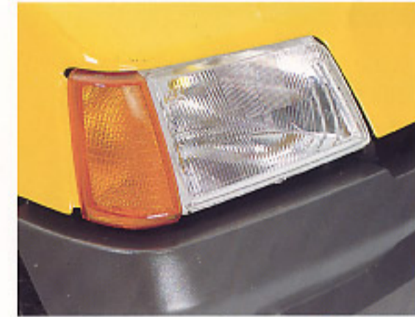
De l'aube à l'aurore un éclairage sûr et efficace pour une plus grande sécurité.