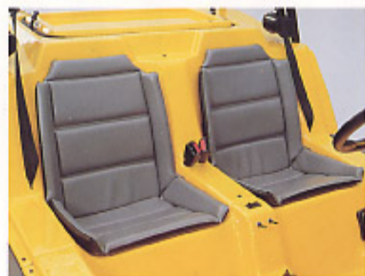
Des sièges confortables et imperméables.