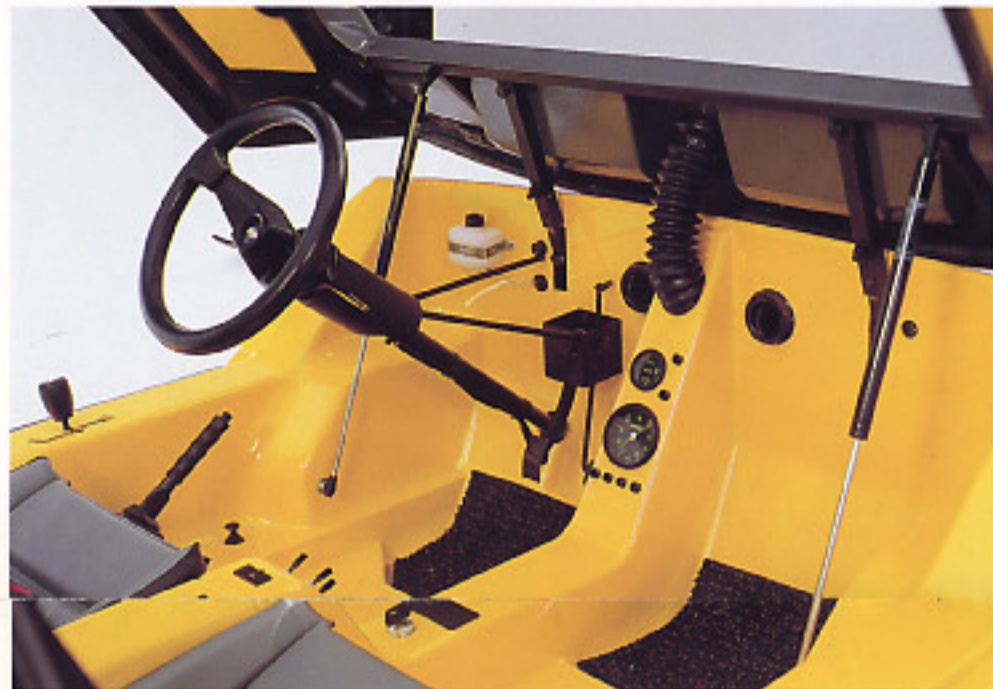
Un tableau de bord sobre, mais où rien ne manque à la sécurité.

Le Cabriolet Junior, c'est un grand morceau de ciel bleu en ville, à la campagne ou à la mer, mais c'est aussi le plaisir de conduire une voiture à la ligne résolument moderne et jeune, par son esthétique, sa finition et sa couleur. La Junior c'est la balade en liberté, en plein air, en sécurité. Rouge cerise ou jaune citron, goûtez au fruit de la passion.