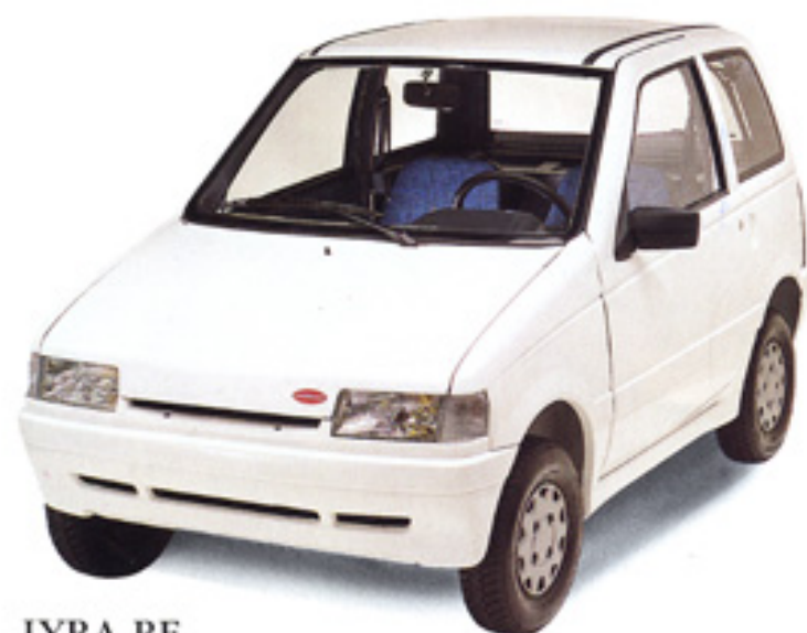
LYRA RE Sans permis.