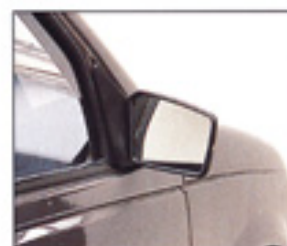
Rétroviseur extérieur droit.