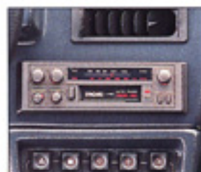
Radio K7. (Option sur RE et SPID 90S).