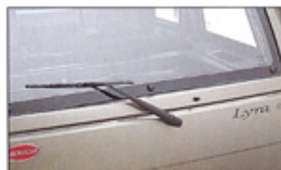
Essuie-glace et lave-glace arrière.