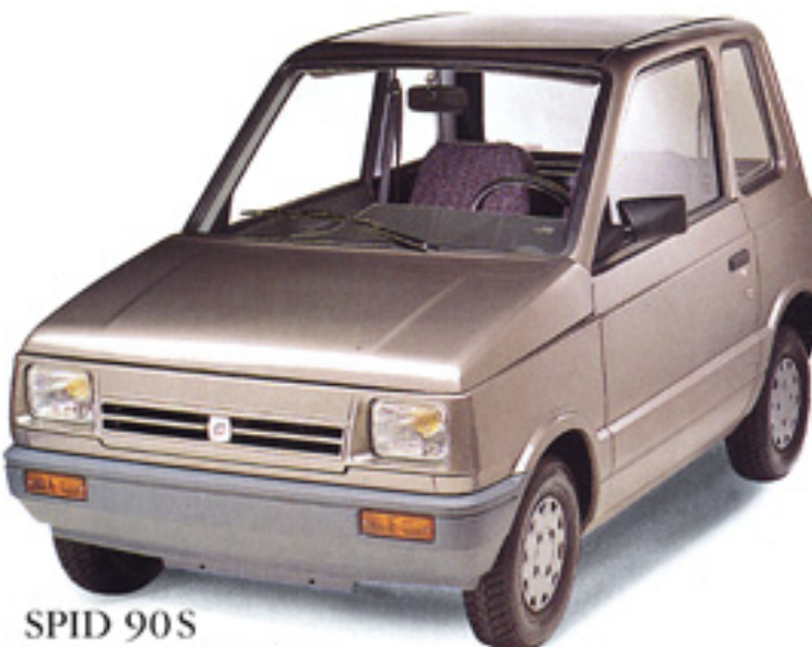
SPID 90S Permis AT ou équivalent.