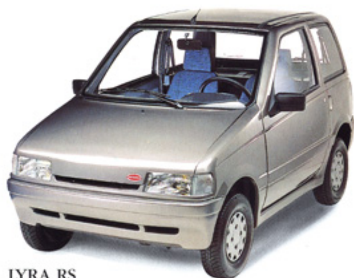
LYRA RS Sans permis.