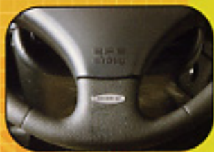
Airbag conducteur dans le volant