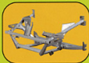
Support moteur absorbeur de choc