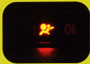
Voyant qui signale la mise en marche du boîtier électronique lors du démarrage (Reste allumé quelques secondes)