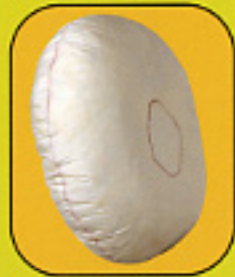
Airbag de 60 litres