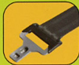
Ceinture de sécurité avec limiteur d'effort