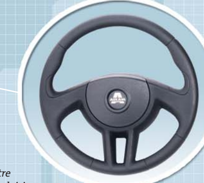
Volant ergonomique : pour votre confort, votre sécurité et votre plaisir.