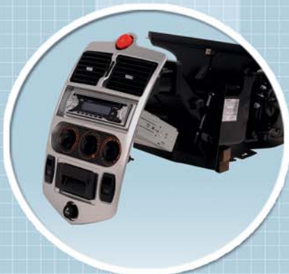
Plus de capacité de chauffage grâce au nouveau système développé spécialement pour AIXAM.