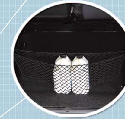
Coffre d'un grand volume, facile d'accès, pour un espace optimisé.