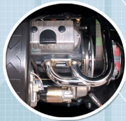
Moteurs Kubota spécifiques AIXAM offrent encore plus de souplesse et une meilleure insonorisation pour un total confort de conduite.