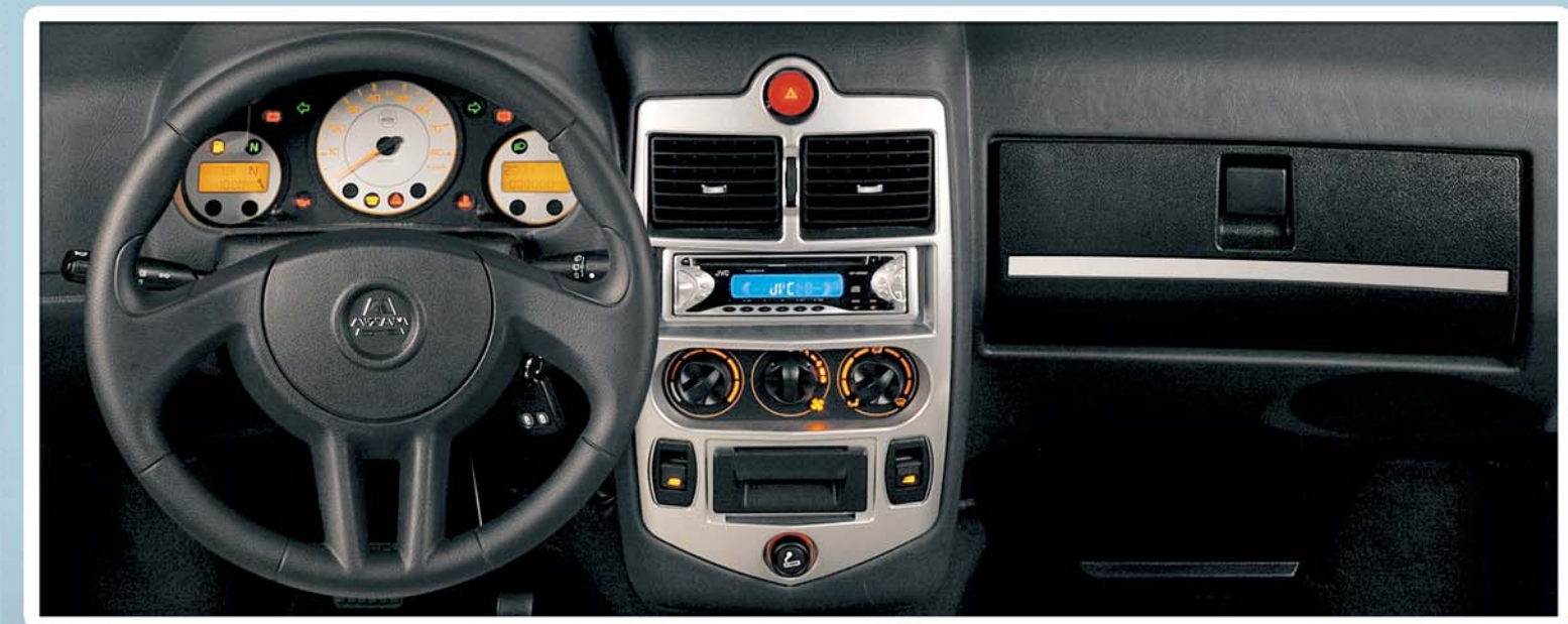
Poste de conduite ergonomique et tableau de bord doté d'une instrumentation très complète et sophistiquée. Un coup d'œil suffit pour tout voir.