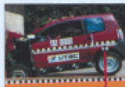
Crash-test frontal - 1996.