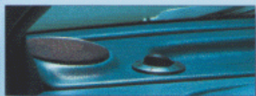
Bouche d'aération orientable pour dégivrage des vitres latérales.