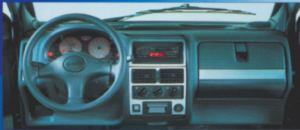
Tableau de bord : instrumentation très complète et sophistiquée, modèle SUPER LUXE.