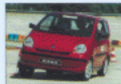
Essais de stabilité - 2000.