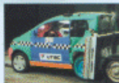
Crash-test arrière - 2000.