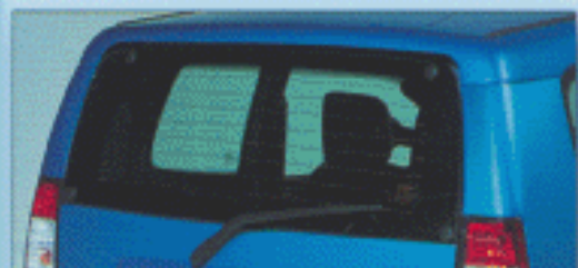
Lunette arrière dégivrante avec essuie-glace.