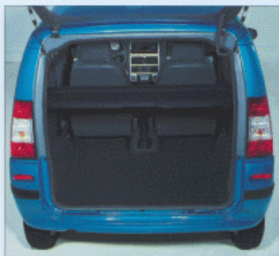
Coffre avec tablette arrière.