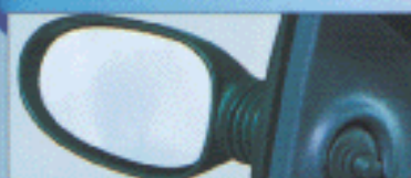
Rétroviseurs réglables de l'intérieur.