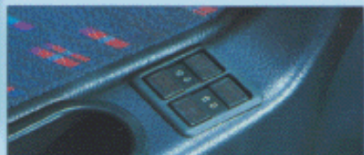
Commande de vitres électriques.