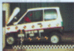
Crash-test frontal - 1988.

Voir le document spécial Sécurité d'AIXAM.