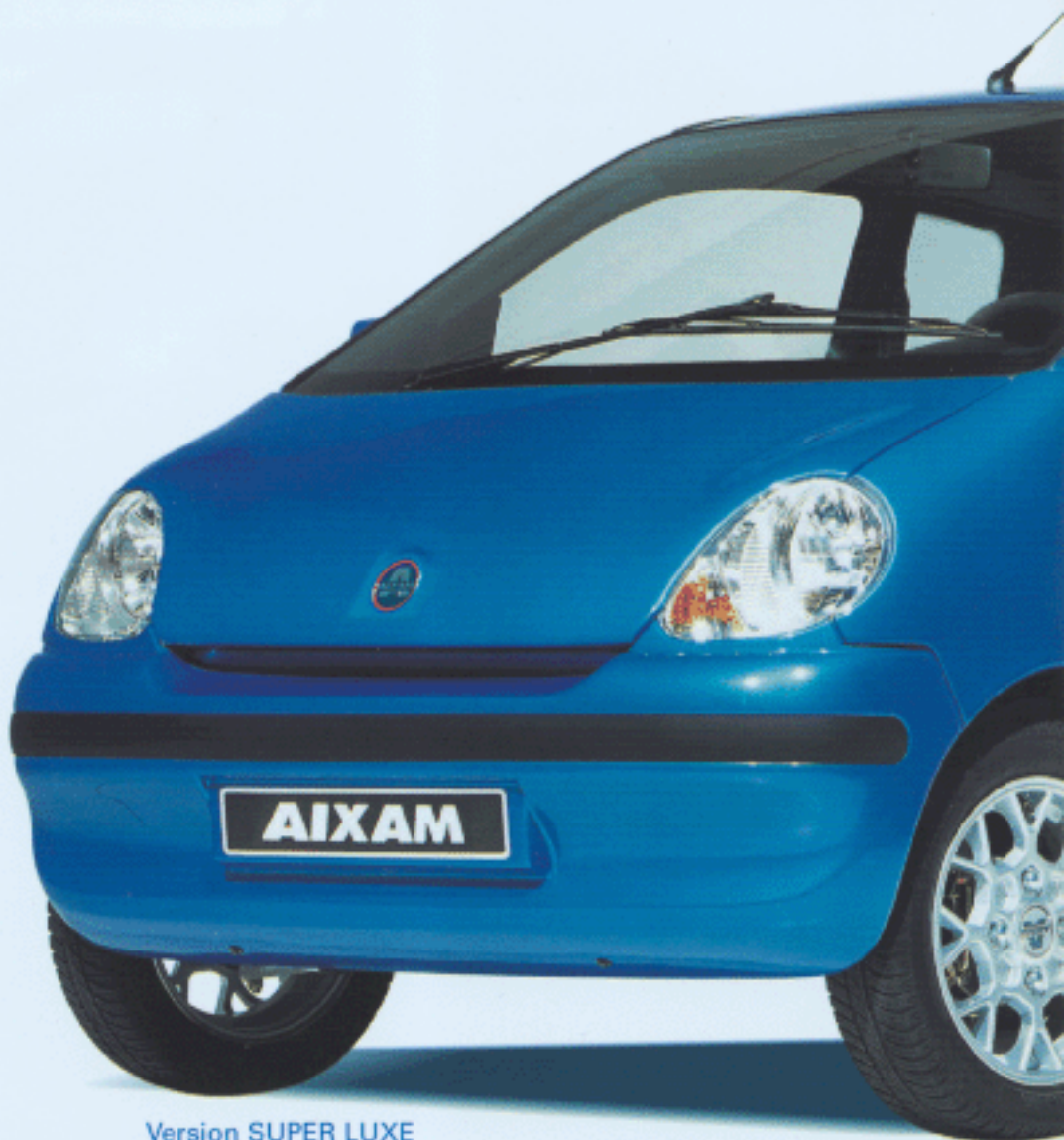
Version SUPER LUXE

Ni rétro ni futuriste, elle s'intègre avec élégance dans le trafic malgré ses petites dimensions, sans se faire remarquer ; sa ligne classique la rend indémodable.