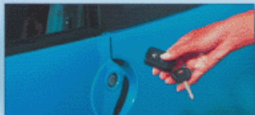
Fermeture centralisée avec télécommande.