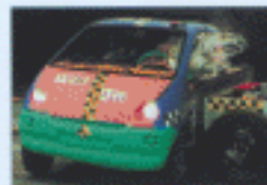
Crash-test latéral avec mannequin - 2000.