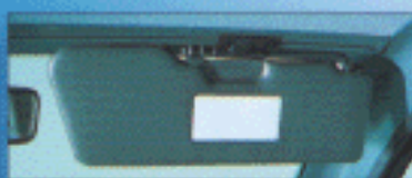
Pare-soleil orientable avec miroir de courtoisie côté passager.