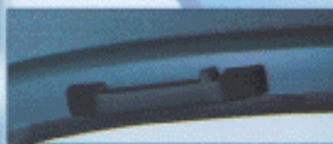
Poignée de maintien passager.